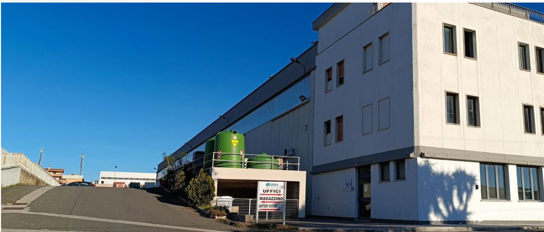
Direzione commerciale e Logistica ROMA