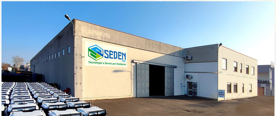
Amministrativo e Logistico di PADOVA

La nostra missione supera la semplice fornitura di servizi: ci impegniamo a trasformare la gestione dei rifiuti da costo operativo a valore ambientale e sociale. Ispirati dal principio delle 4R (Riduzione, Riutilizzo, Riciclo e Recupero), operiamo con l'obiettivo di migliorare la qualità della vita delle comunità, garantendo processi certificati e soluzioni tecnologiche all'avanguardia che rispettano rigorosamente i Criteri Ambientali Minimi (CAM).